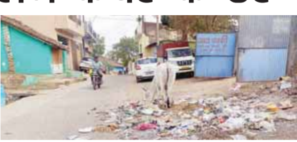
सामने मेन रोड (वार्ड 2) और वार्ड 14 में बजरंग बाल विहार के आगे सिलगौर रोड पर नियमित रूप से कचरे के ढेर देखे जा सकते हैं। सड़क किनारे पड़े कचरे को जानवर इधर-उधर फैला देते हैं, जिससे राहगीरों को परेशानी होती है। स्थानीय लोगों का कहना है कि कई-कई दिनों तक कचरा नहीं उठाया जाता और सफाई कर्मचारी