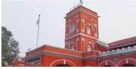
समस्या को महापौर ने गंभीरता से लिया और तत्काल प्रशासन के साथ इस विषय पर चर्चा शुरू की।