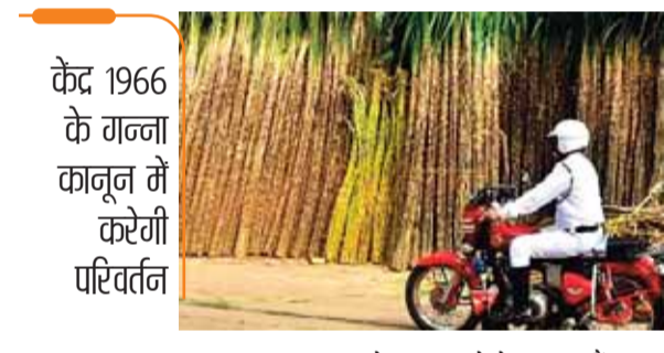
केंद्र 1966 के गन्ना कानून में करेगी परिवर्तन

गन्ने से जुड़ा पुराना कानून बदलेगा सरकार का नियामक ढांचे से बदलने का प्रस्ताव, मांगे सुझाव