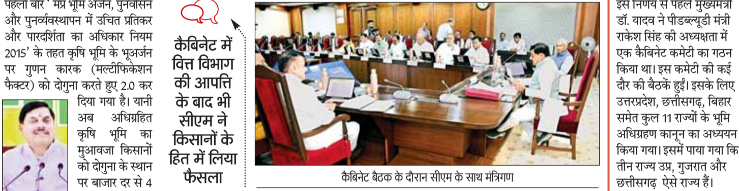
कैबिनेट बैठक के दौरान सीएम के साथ मंत्रिमण

सीएम ने प्रेस कॉन्फ्रेंस कर बताया कि मप्र पहला ऐसा राज्य है, जहां किसानों को उनकी भूमि का अधिग्रहण करने पर चार गुना मुआवजा दिया जाएगा