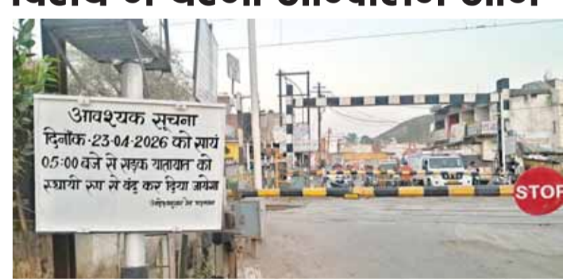
लगाणा पडगा साथ ही ओवर ब्रिज में स्टीट लाइट न होने के कारण रात में लूट व अपराधिक घटनायें घटने के साथ समय व आर्थिक रूप से हानि होगी साथ ही दुर्घटनायें होने की संभावना बनी रहेगी और इसी कारण आमजन रात में ओवर ब्रिज से आना जाना नहीं करते है। इसी तरह यहां करीब दस हजार को आबादी निवास करने के साथ स्कूल कालेज के छात्र छात्राओं के साथ उस तरफ से इस तरफ भी छोटे बच्चे साईकिल से पढ़ने आते हैं साथ ही अंतिम यात्रा भी यहीं से जाती है। सारे लोग खरीददारी करने इसी फाटक से पैदल चलकर खितौला बाजार आते हैं। सभी का कहना है की रेलवे का यह आदेश वे स्वीकार नहीं करेंगे।