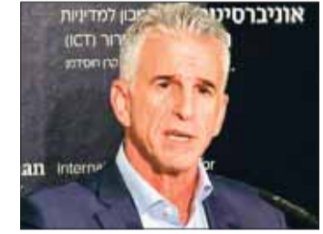
मोसाद प्रमुख डेविड बार्निया