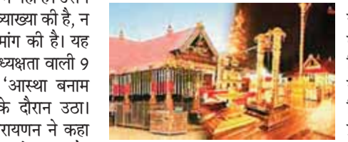
तमिलनाडु में 30,000 मंदिरों का प्रबंधन हो रहा

केंद्र ने कहा कि उसने केवल संविधान के प्रावधानों की व्याख्या की