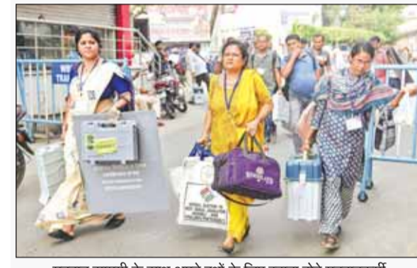
मतदान सामग्री के साथ अपने बूथों के लिए रवाना होते मतदानकर्मी

सीजफायर बढ़ाने का अनुरोध किया था। हमसे कहा गया है कि हम ईरान पर तब तक हमले न करें, जब तक कि उनके नेता और प्रतिनिधि एकमत से कोई प्रस्ताव लेकर नहीं आ जाते हैं। माना जा रहा है कि मध्यस्थ पाकिस्तान को अमेरिका और ईरान के बीच बातचीत का नया दौर आयोजित करने के लिए समय मिल गया है।