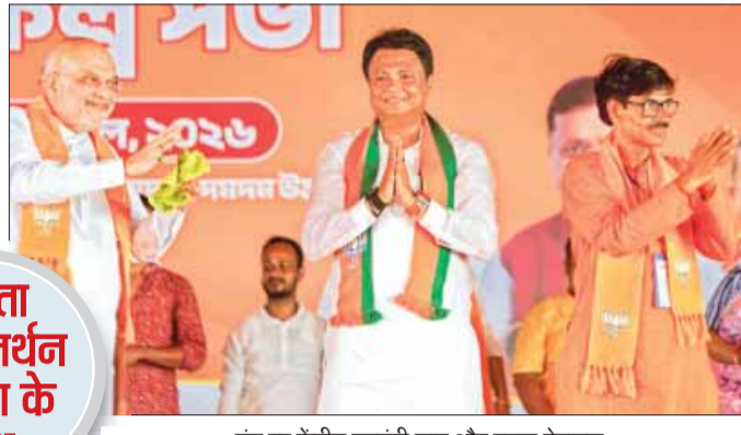
मंच पर केंद्रीय गृहमंत्री शाह और प्रमुख नेतामण

कांग्रेस को असम में मिलेगी सबसे बुरी हार टीडी की हालत भी कमजोर, वे बाहर होंगी