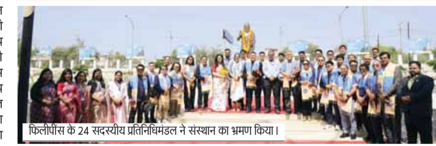
फिलीपींस के 24 सदस्यीय प्रतिनिधिमंडल ने संस्थान का भ्रमण किया।

युवाओं को रोजगार से जोड़ने में मप्र का स्किलिंग इको सिस्टम बना मिसाल