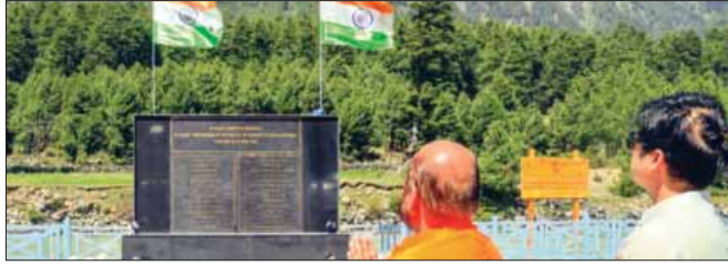
हमले में मारे गए मासूमों के स्मारक पर श्रद्धांजलि देते लोग

पहलगाम आतंकी हमले को 22 अप्रैल को एक साल पूरा हो गया है और इस मौके पर पीएम नरेंद्र मोदी ने उस दर्दनाक घटना में जान गंवाने वाले निर्दोष लोगों को याद किया। उन्होंने कहा कि उनकी संवेदनाएं उन सभी परिवारों के साथ हैं, जो आज भी इस अपार दुख को झेल रहे हैं। उन्होंने कहा कि भारत आतंकवाद के आगे कभी नहीं झुकेगा और न ही कभी आतंकवादियों के नापाक मंसूबे कामयाब होंगे