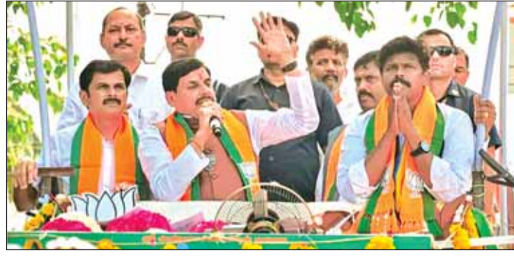
तमिलनाडु में रोड शो करते मुख्यमंत्री डॉ. मोहन यादव व भाजपा प्रत्याशी।