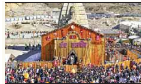
केदारनाथ धाम के कपाट खुलने के बाद लगा भक्तों का तांता